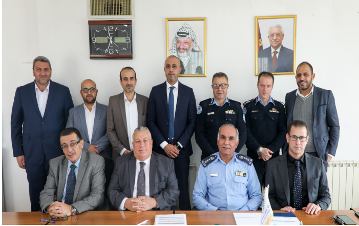
الكروي الإلكتروني لحوادث الطرق.

وتجدر الإشارة، إلى أن هيئة سوق رأس المال قامت برعاية الحوار بين مختلف الجهات المعنية بالحد من هذه الظاهرة ومعالجة أثارها، وتكللت هذه الجهود بالاتفاق على تطوير نظام المخطط "الكروي" الإلكتروني بين الشركاء الرئيسيين المتمثلة بالإدارة العامة لشرطة المرور والاتحاد الفلسطيني لشركات التأمين والصندوق الفلسطيني لتعويض حوادث الطرق.