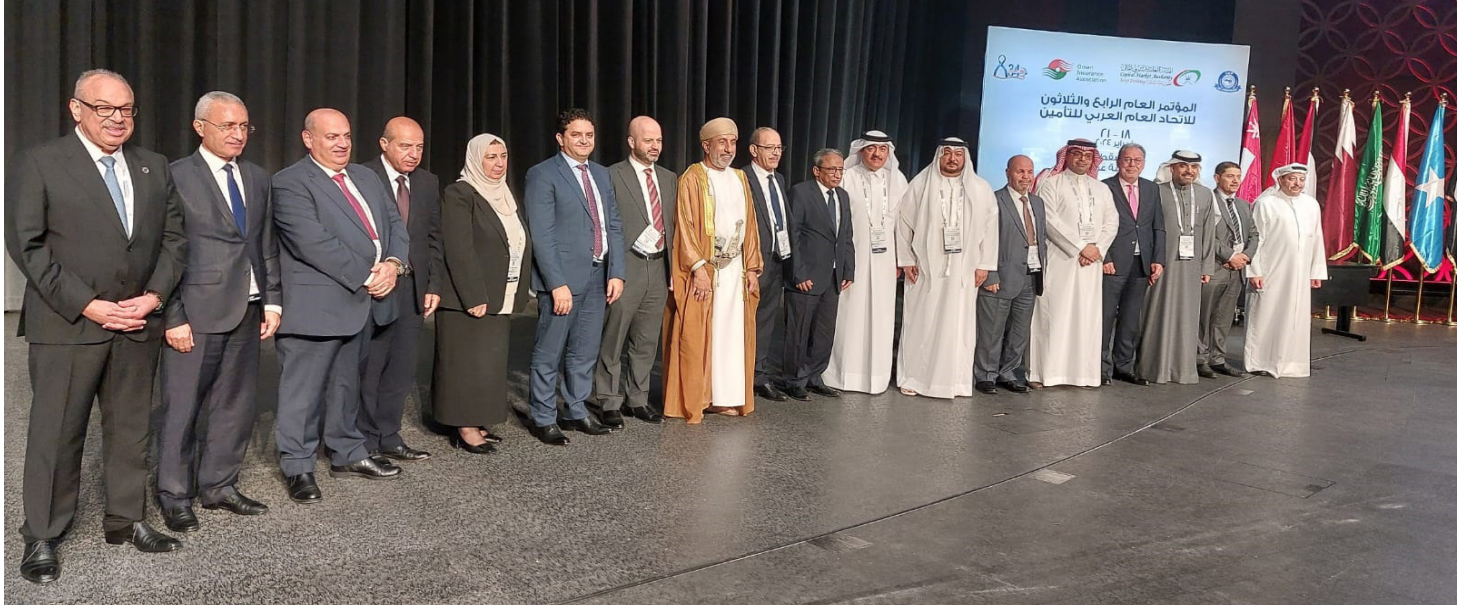
اجتماعات مجلس الاتحاد العام العربي للتأمين

بعد انتهاء فعاليات أضخم تظاهره تأمينية إقليمية في المنطقة العربية بمشاركة 2200 مشارك من 59 دولة، نستعرض معكم لمحات سريعة من هذا الحدث الهام: